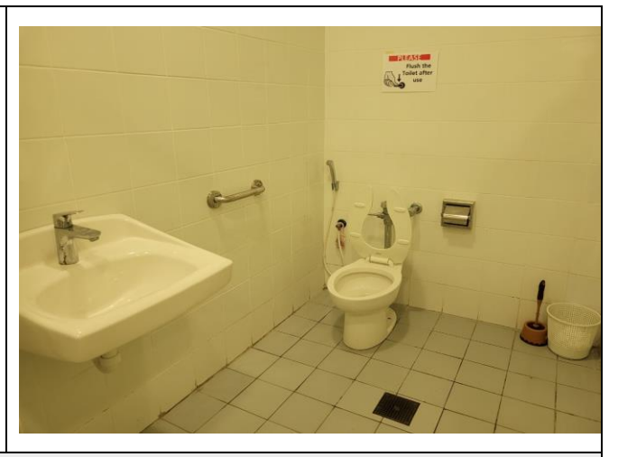
Rest Rooms for Differetly Abled