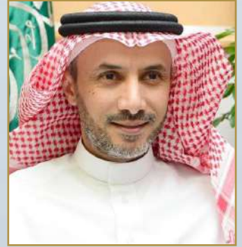
أ.د. فهد بن أحمد الحربي

طلابي وطالباتي الخريجين... إن هذا الوطن لم يبخل عليكم فقد كان لكم أرضاً ودفناً وعزاً وتمكيناً، فمن الواجب علينا وعليكم أن نرد بعض جميله وحقه بالصدق والإحسان في العمل، دامت أفراحكم وازدان جبين جامعتكم بنجاحكم وتخرجكم.