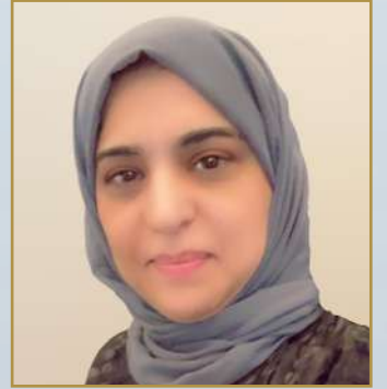
د. نهاد بنت عبدالله العمير نائب رئيس الجامعة للتطوير والشراكة المجتمعية

ابناتي الطلبة والطالبات ، مبارك تخرجكم ، مبارك هذا التميز ، مبارك هذا النجاح .. يسرني ان أكون من أوائل المهنيين لكم على هذه المرحلة التي انجزتموها في دروب الحياة ، تلك المرحلة المتوجة بالطموح والمكّلة بالفلاح والتي وصلت بكم في نهاية المطاف إلى درب النجاح ، فهنيئاً لكم . ابناتي ، التّخرّج ليس نهاية الطّريق، بل إنّهُ تتويجٌ لمسيرة علميّة حافلة وطريق محفوف بالعقبات والتّحديات، كما أنّهُ بداية طريق جديد إلى الحياة العمليّة التي يثبت فيها الإنسان كفاءته واستحقاقه لشهادته العلميّة، وما يحقّقه من فائدةٍ لنفسه وللتّخرين، فالعلم غاية نبيلة لا تتحقّق إلّا بالفائدة المتحصلة منه، وإنّ علماً بلا منافع علمٌ لا قيمة له ولا وزن، حيث يتنقل الإنسان من مرحلة التّحصيل إلى مرحلة التّنفيد واستعمال العلم، وهو ما يختلف من شخصٍ إلى آخٍ ، فإنّ المعالي لا تتال إلّا ببذل الغالي ولا يبلغ الإنسان غاية شريفة إلّا بعد تعبٍ وصبرٍ واجتهاد ، وأخيراً، تمنياتنا القلبية لكم بدوام التّقدم والنجاح ومستقبلاً مشرقٍ بإذن الله .