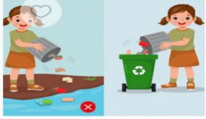
آداب النظافة 2