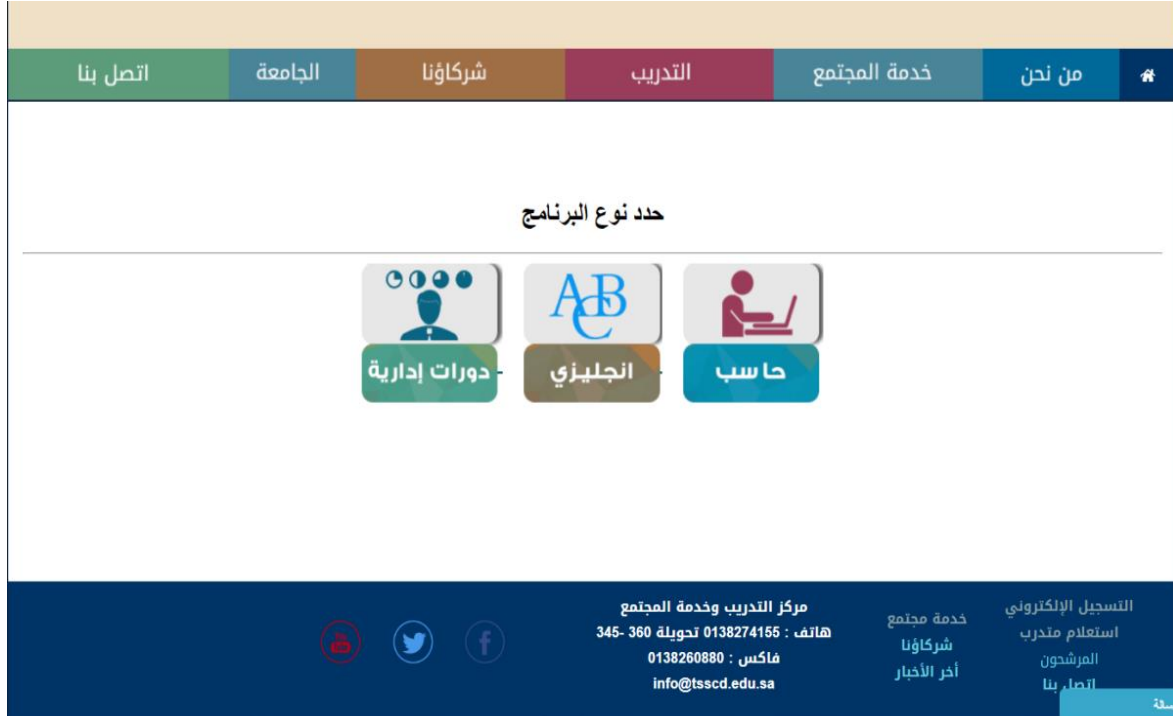
رسم توضيحي 4 : اختيار نوع البرنامج